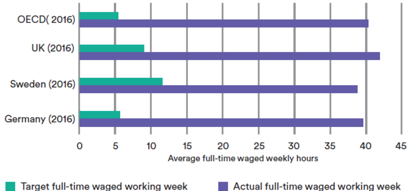
Tatsächliche vs. angestrebte Wochenarbeitszeit

Um die globale Erhitzung auf 2°C zu begrenzen, muss die Wirtschaftstätigkeit – und damit die Arbeitszeit – in den OECD-Ländern auf durchschnittlich sechs Stunden pro Woche reduziert werden.